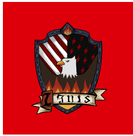
Nhà Ignis: đại diện cho sự mạnh mẽ và nhiệt huyết